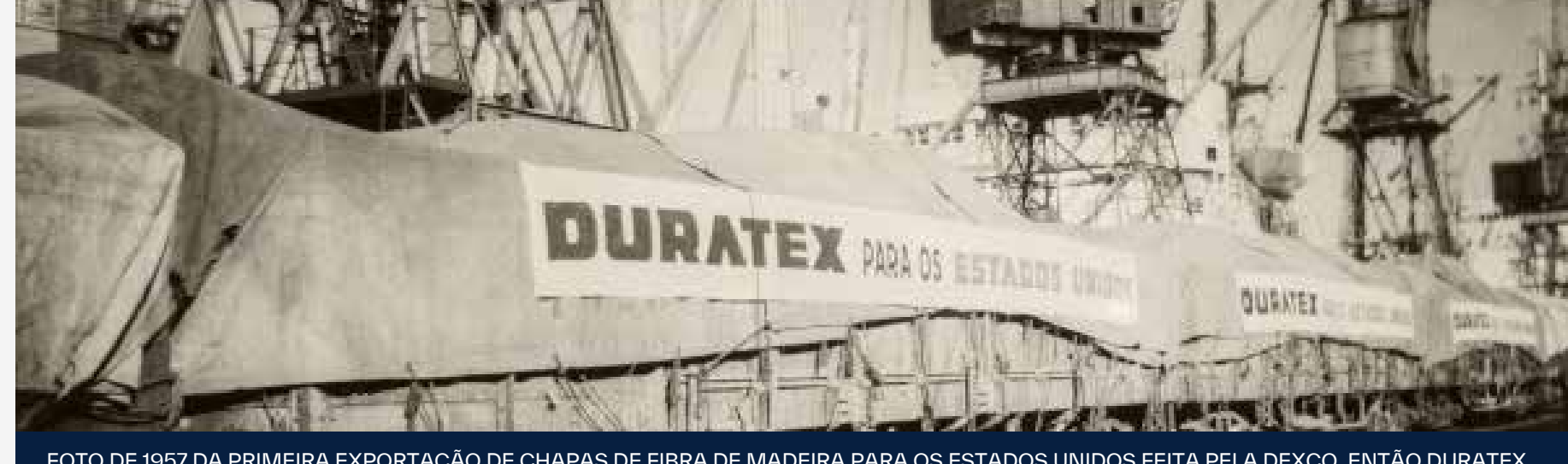
FOTO DE 1957 DA PRIMEIRA EXPORTAÇÃO DE CHAPAS DE FIBRA DE MADEIRA PARA OS ESTADOS UNIDOS FEITA PELA DEXCO, ENTÃO DURATEX.